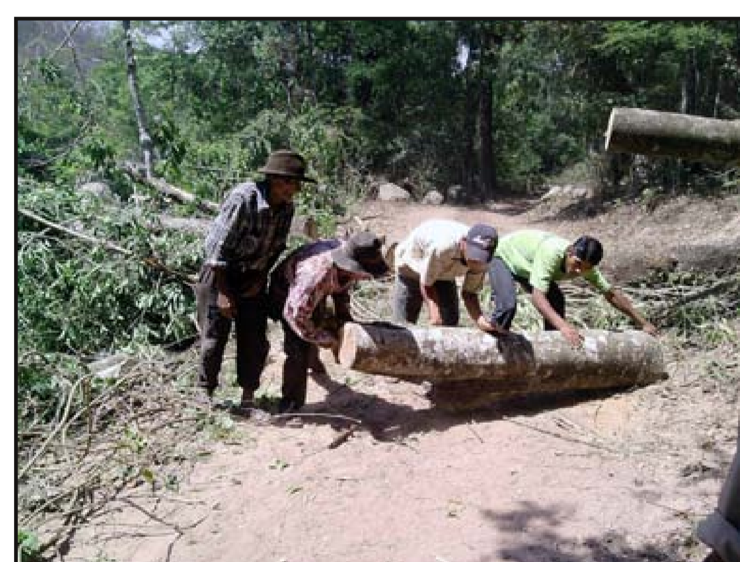
Destronque y limpieza con apoyo de comunarios de Cañon Verde