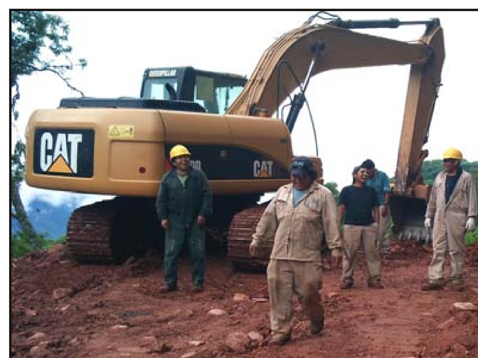
Personal de Mano a Mano - Nuevo Mundo disponiéndose a iniciar la jornada