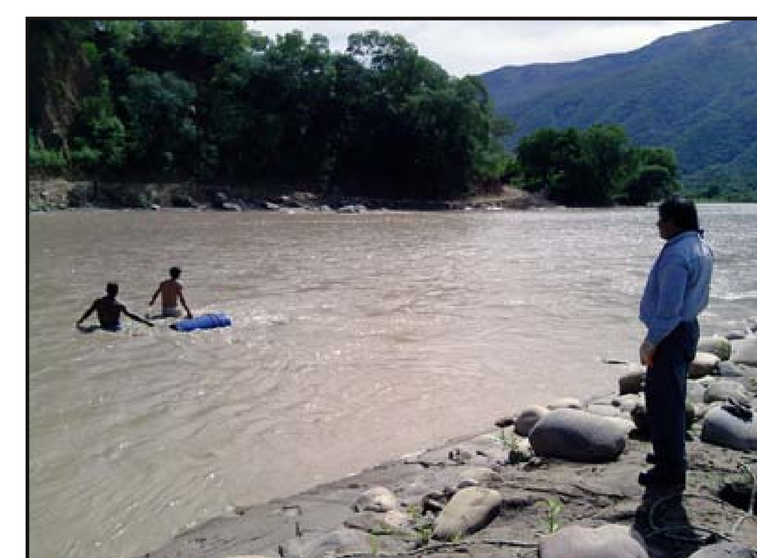
Traslado de combustible para maquinaria cruzando el río Pilaya