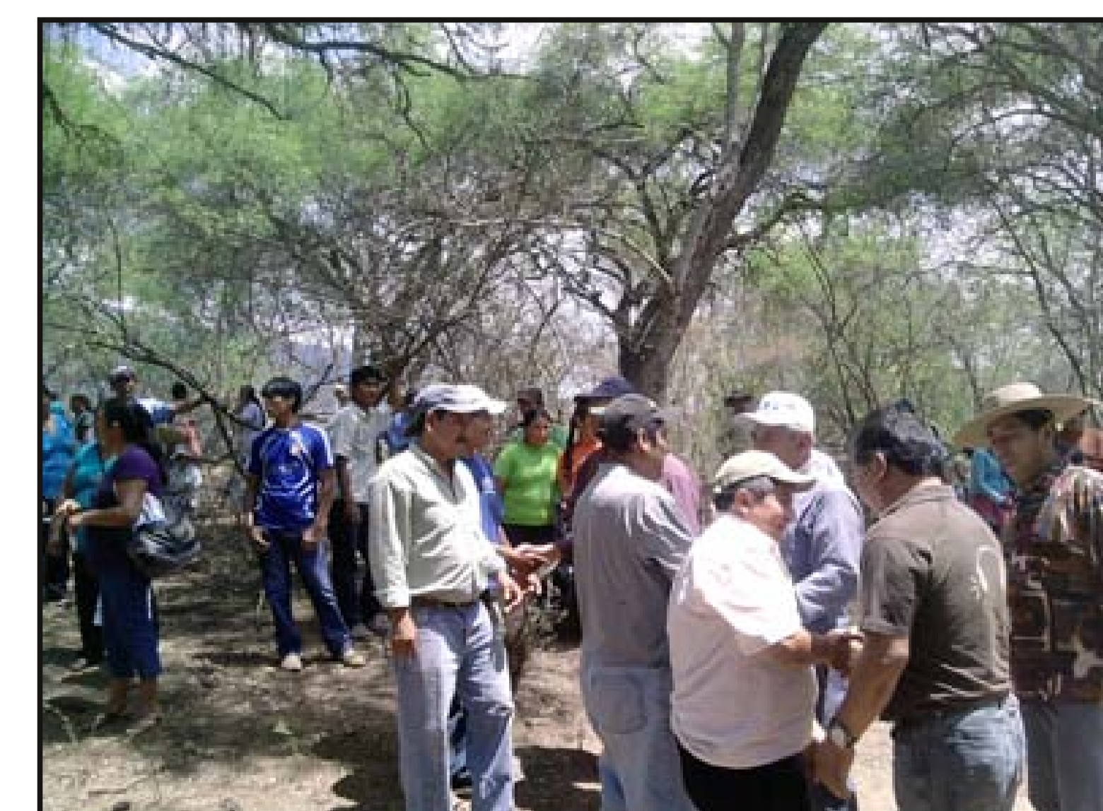
Recibimiento de autoridades municipales y comunarios en inicio de obras