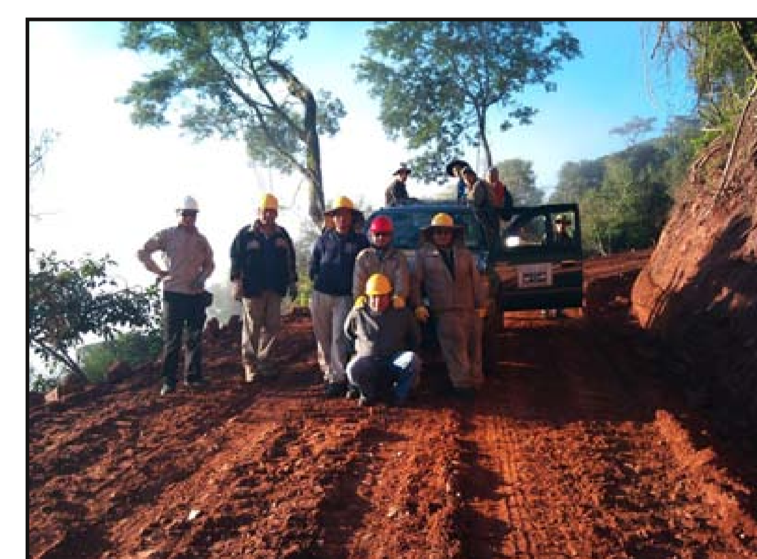
Personal de Mano a Mano - Nuevo Mundo y comunarios trasladándose al avance de obra