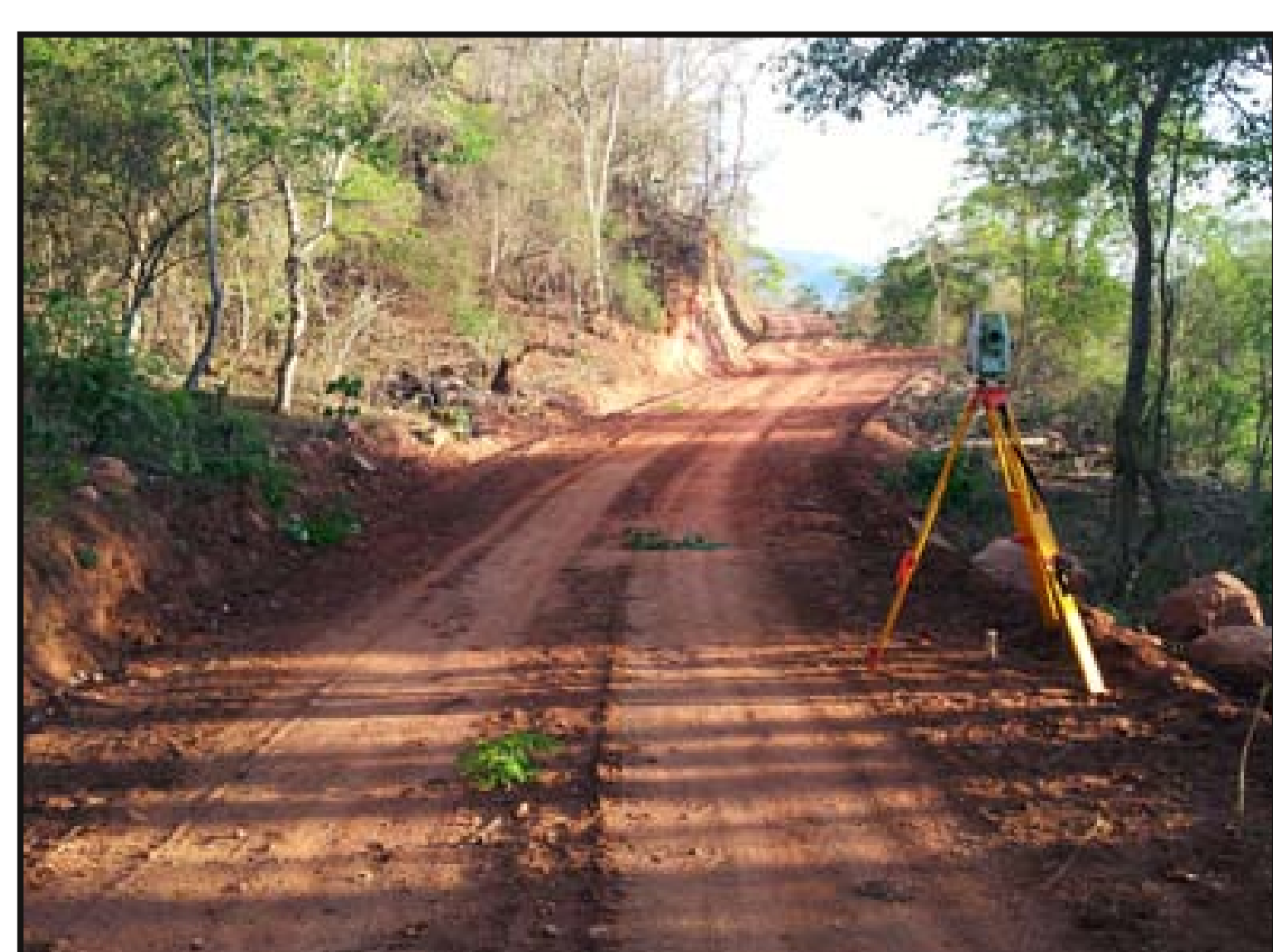
Medición topográfica para el cálculo de movimiento de volúmenes de tierra