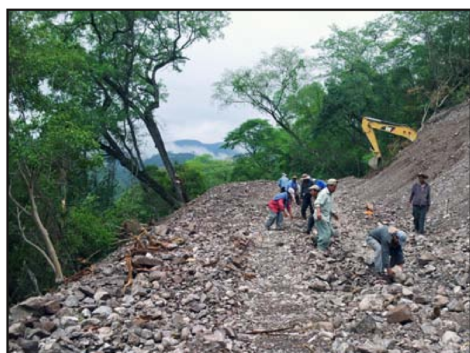
Limpieza manual de plataforma con ayuda de comunarios y maquinaria