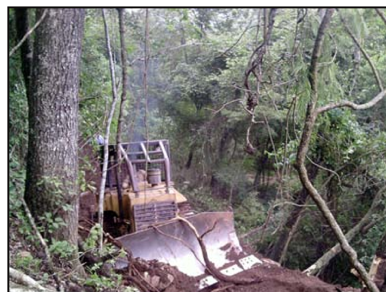
Inicio de apertura de senda con tractor oruga CAT y motosierras