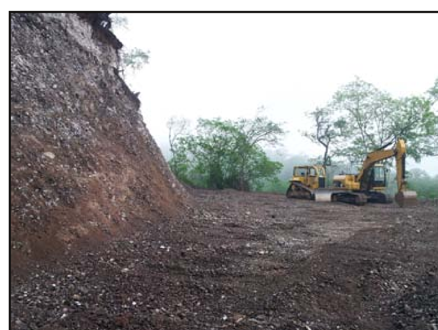
Afinado y peinado de talud y plataforma con tractor oruga y excavadora