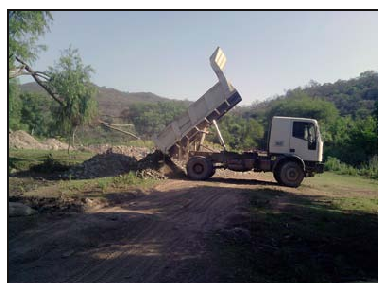
Traslado de material y ripiado de plataforma