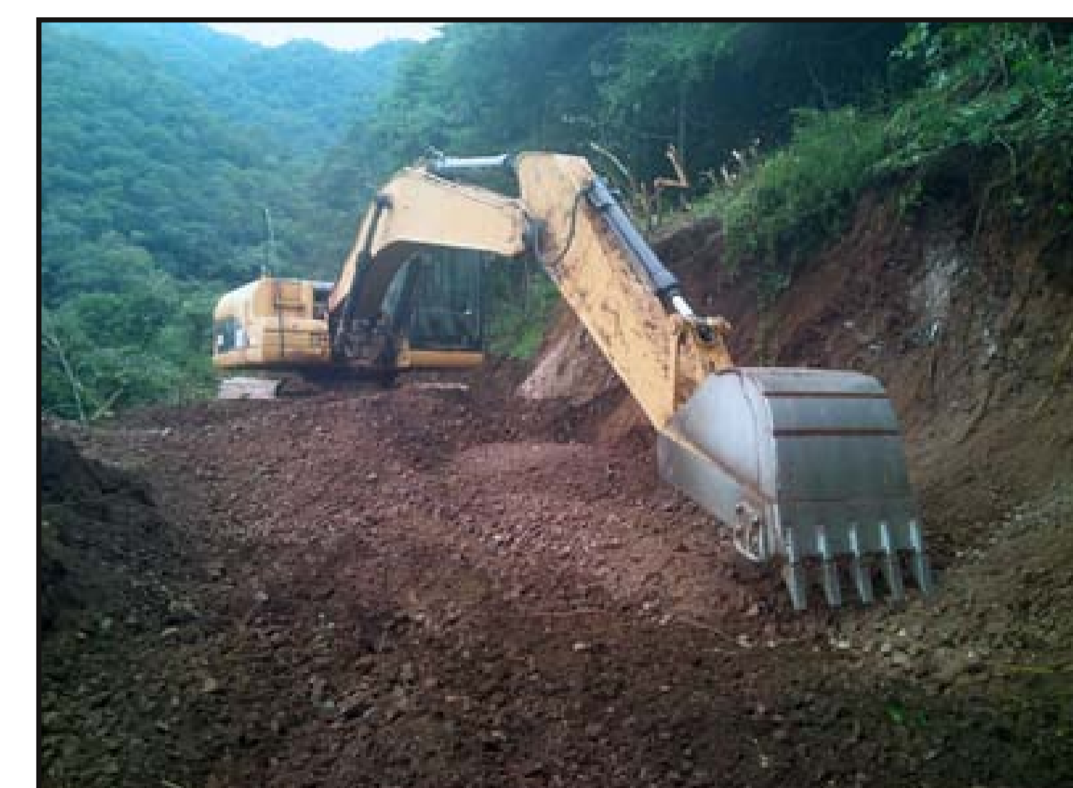
Excavación y rebaje de plataforma con excavadora