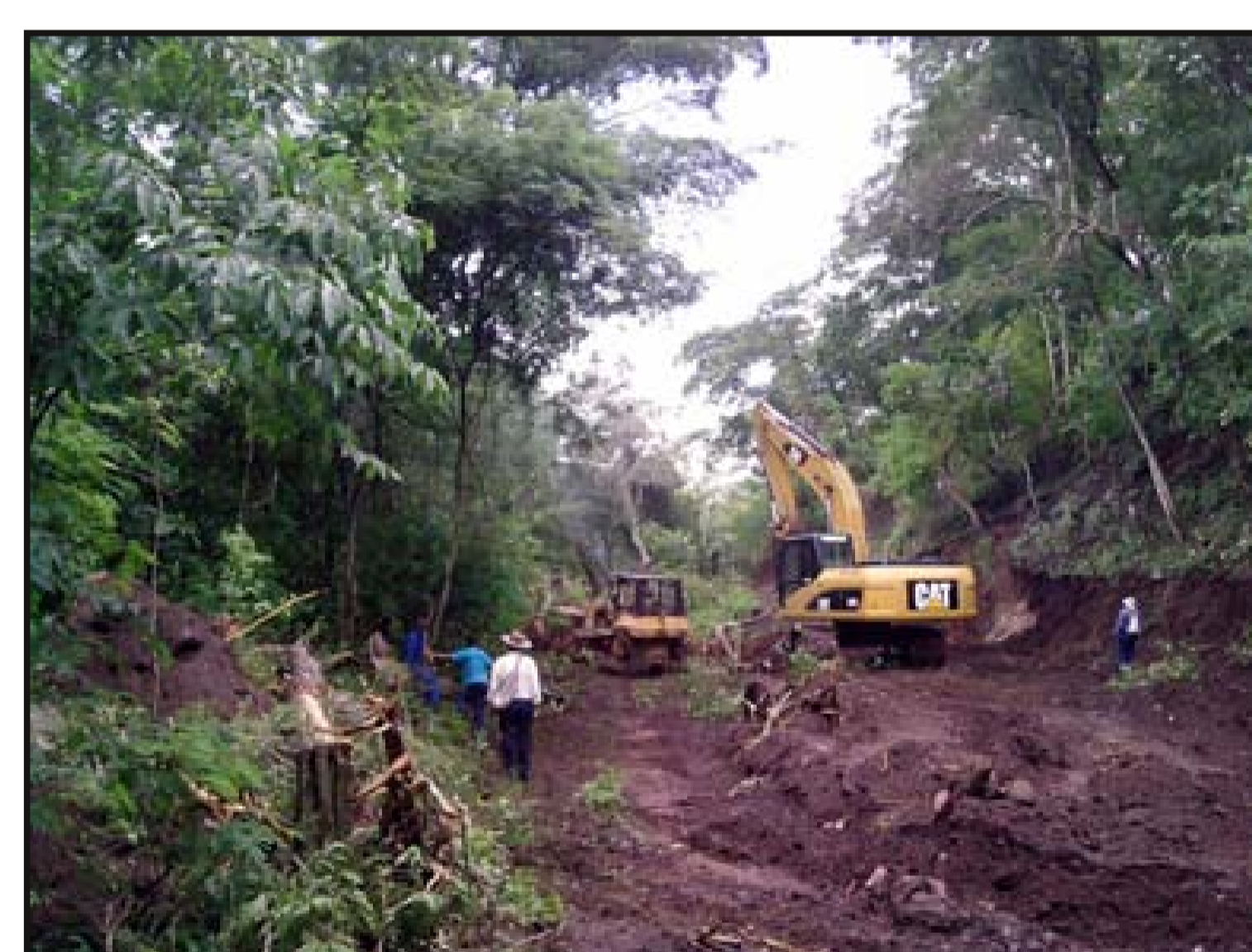
Apertura de camino con tractor oruga y excavadora CAT