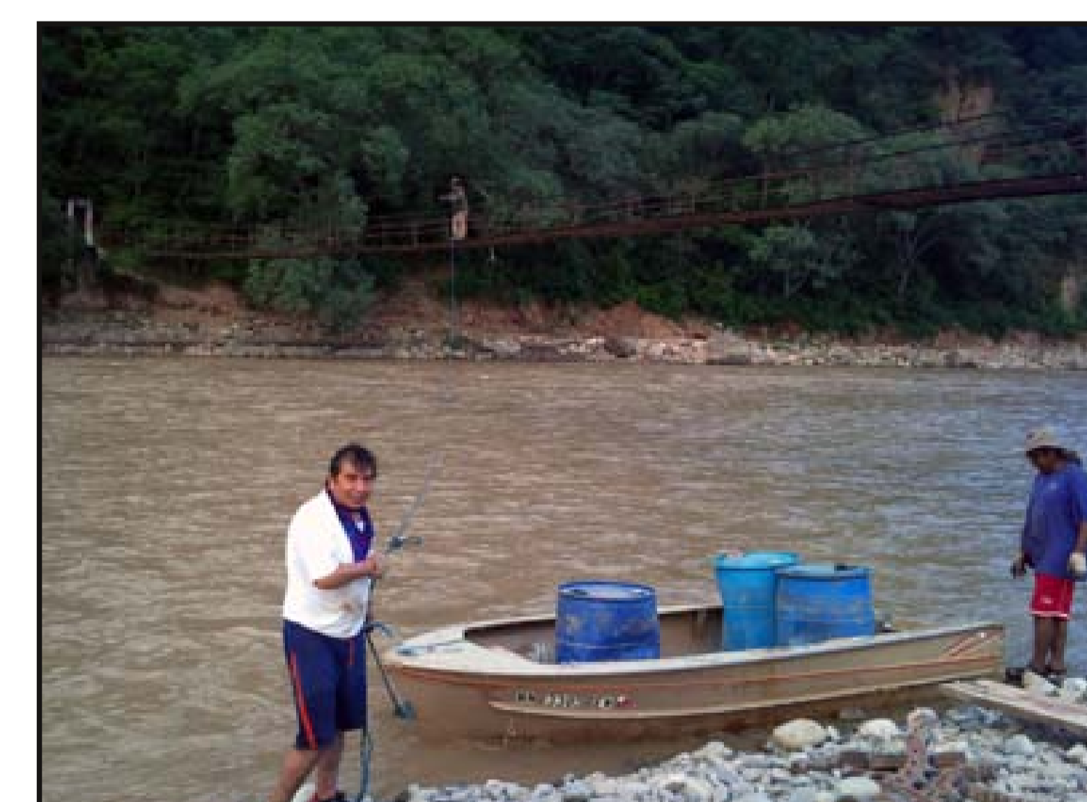
Acopio de combustible en epoca lluviosa cuando el río es intransitable