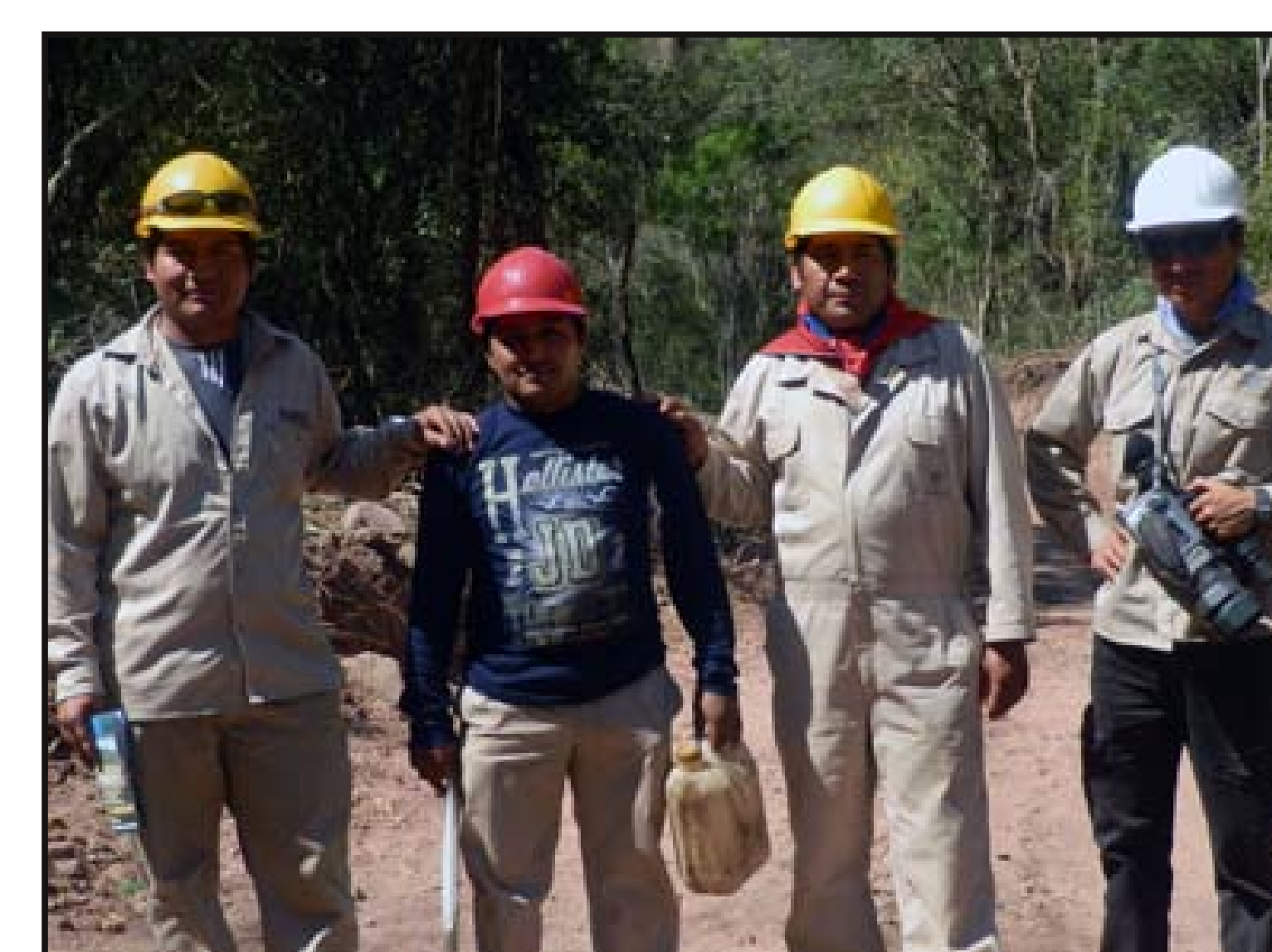
Personal activo en la construcción del camino