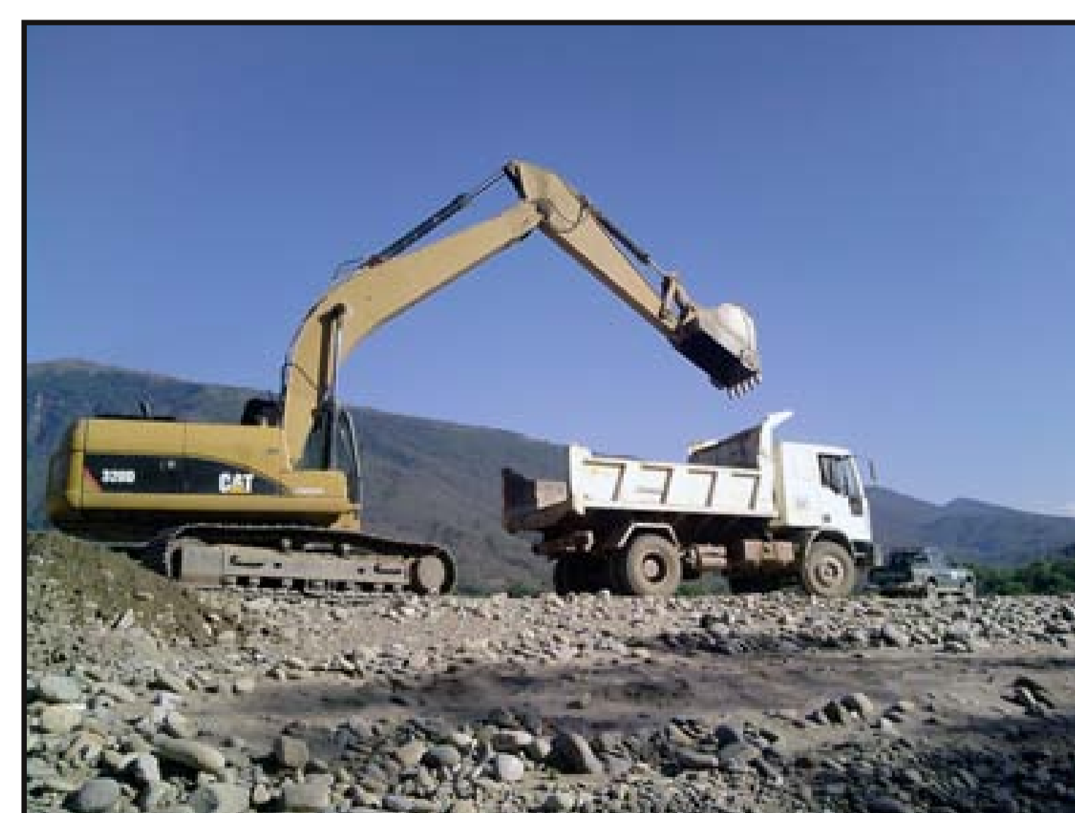
Carguio de material para el ripiado de la plataforma del camino