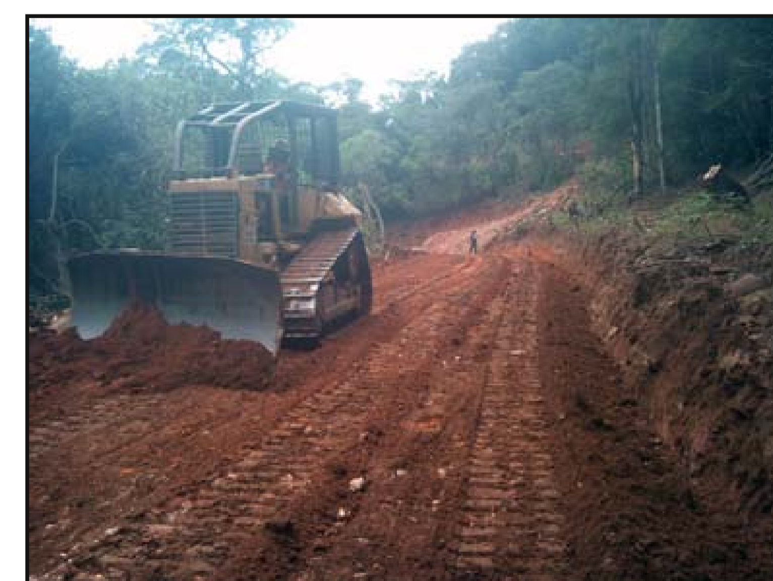
Perfilado y excavación de cuneta con tractor oruga