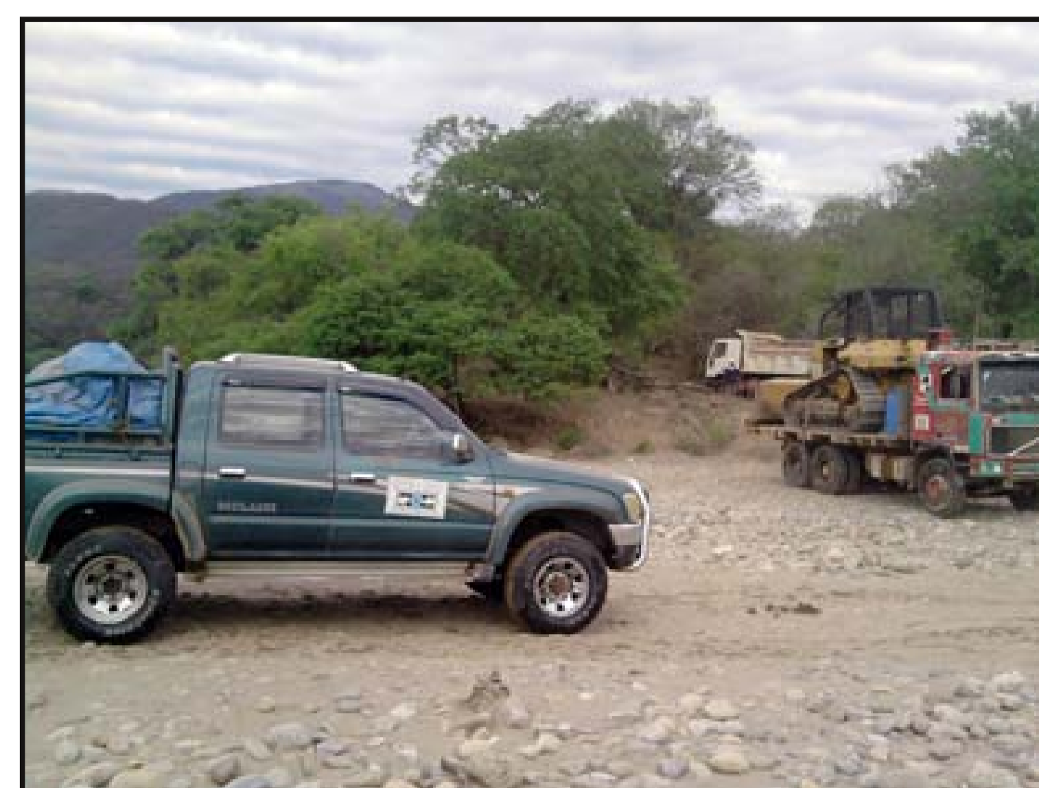
Movilización de maquinaria pesada desde Cbba a Cañon Verde (Chuquisaca)